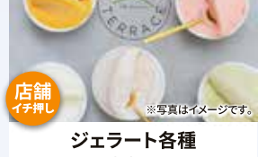
ジェラート各種 480円~