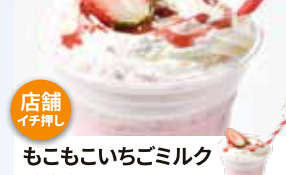
もこもこいちごミルク 600円 ※無くなり次第終了