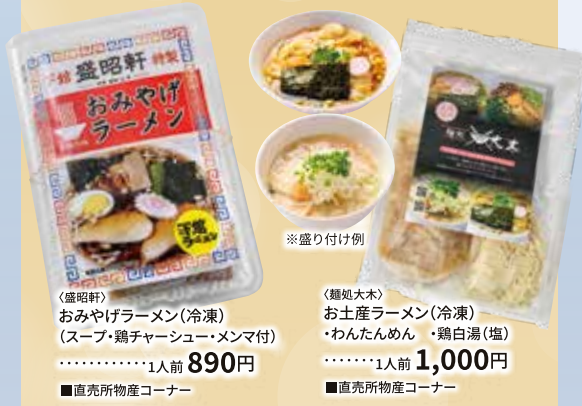
〈盛昭軒〉 おみやげラーメン(冷凍) (スープ・鶏チャーシュー・メンマ付) ……………1人前 890円 ■直売所物産コーナー