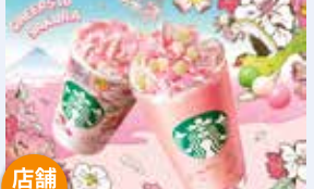
花見だんごフラベチーノ® ※Tall サイズのみ