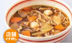
けんちんそば 並盛 930円 大盛 1,030円