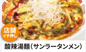
酸辣湯麺(サンラータンメン) 並 880円 大盛 990円