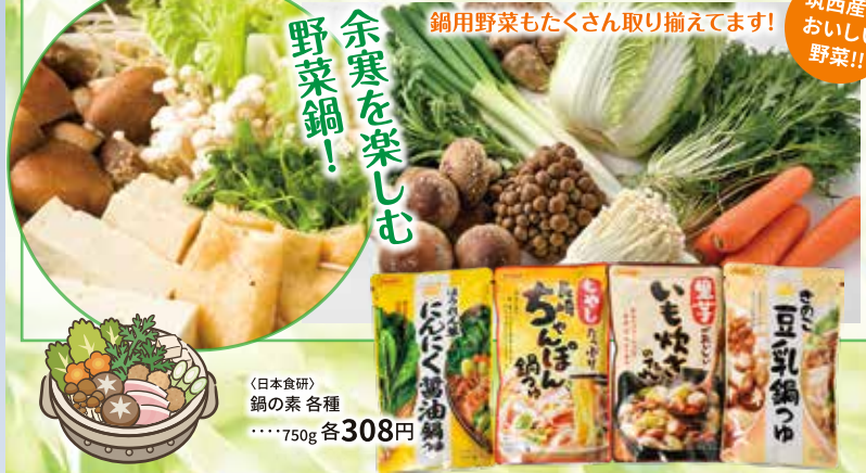
筑西産の おいしい 野菜!!