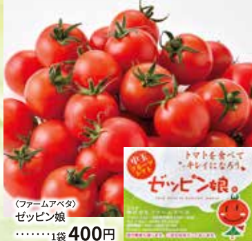
〈ファームアベタ〉 ゼピン娘 ……………1袋 400円