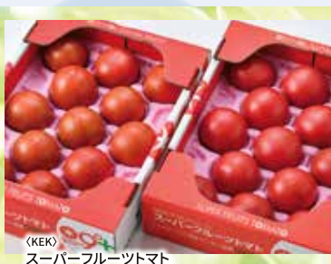
(KEK) スーパーフルーツトマト ……………1箱 2,200円