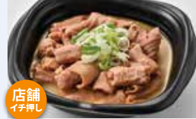
もつ煮 300g 650円