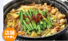
博多風もつ鍋うどん 1,650円