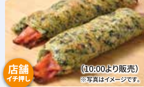
ほうれん草のフロマージュ 1個 320円 ※無くなり次第終了