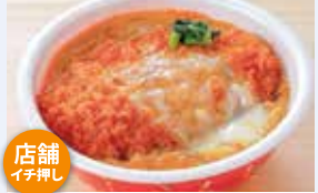
HOT CHEF カツ丼 560円(8%税込 604.80円)