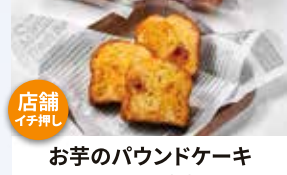
お芋のパウンドケーキ 1本 1,500円