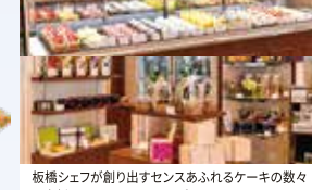
桜橋シェフが創り出すセンスあふれるケーキの数々 と高橋オーナーフルリストデザインのアレンジフラ ワーのコラボレーションをお楽しみください。