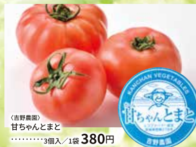
〈吉野農園〉 「甘ちゃん」とまと ……………3個入/1袋 380円