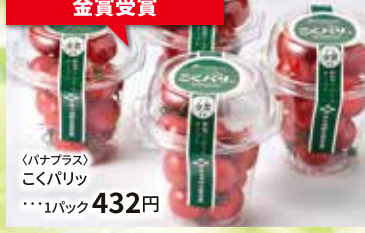
野菜ソムリエサミット 金賞受賞 ……………1パック 432円