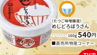
〈たつこ味噌醸造〉 めしどろぼうさん ……160g 540円 ■直売所物産コーナー