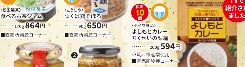
〈セイフ食品〉 よしもとカレー ちくせいの梨編 ……200g 594円 ※筑西市産梨使用 ■直売所物産コーナー