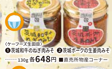
① 茨城和牛のねぎ肉みそ ② 茨城ポークの生姜肉みそ ……130g 各648円 ■直売所物産コーナー