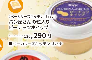
〈ペーカリーズキッチン オハナ〉 パン屋さんの粒入り ピーナッツホイップ ……130g 290円 ■ペーカリーズキッチン オハナ