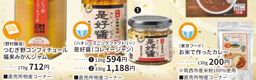
〈野村醸造〉 つむぎ野コンフィチュール 福来みかんジャム ……170g 712円 ■直売所物産コーナー