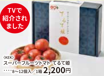
〈KEK〉 スーパーフルーツマト てくて姫 ……8~12個入/1箱 2,200円