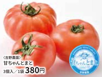
〈吉野農園〉 甘ちゃんトマト 3個入/1袋 380円