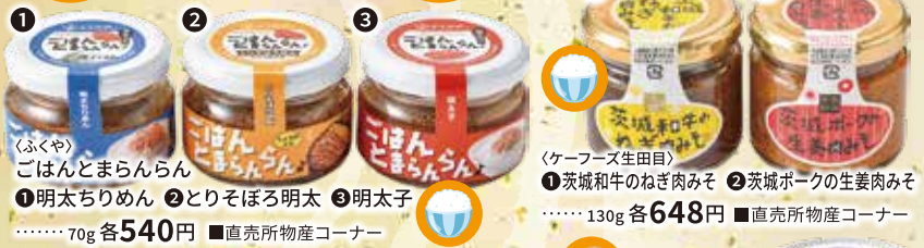
〈ぶくや〉 ごはんとまらんらん ① 明太ちりめん ② とりそぼろ明太 ③ 明太子 ……70g 各540円 ■直売所物産コーナー